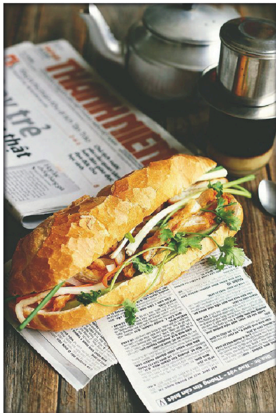
L'iconico "Bánh Mì" vietnamita

Comunicare eventuali intolleranze o allergie