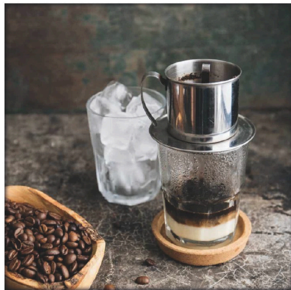
Il filtro "Phin"

Cà Phê Dừa Hot/Ice 5.00 € Caffè al Cocco