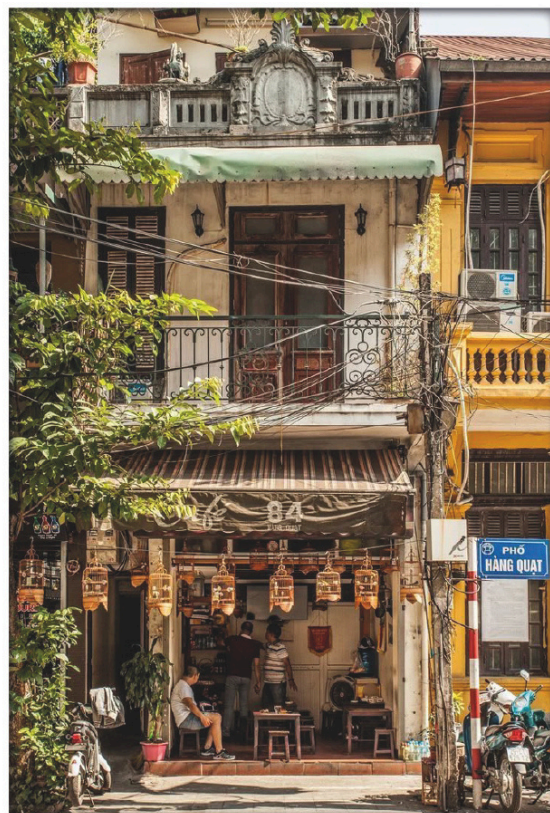
L'architettura dell' Old Quarter